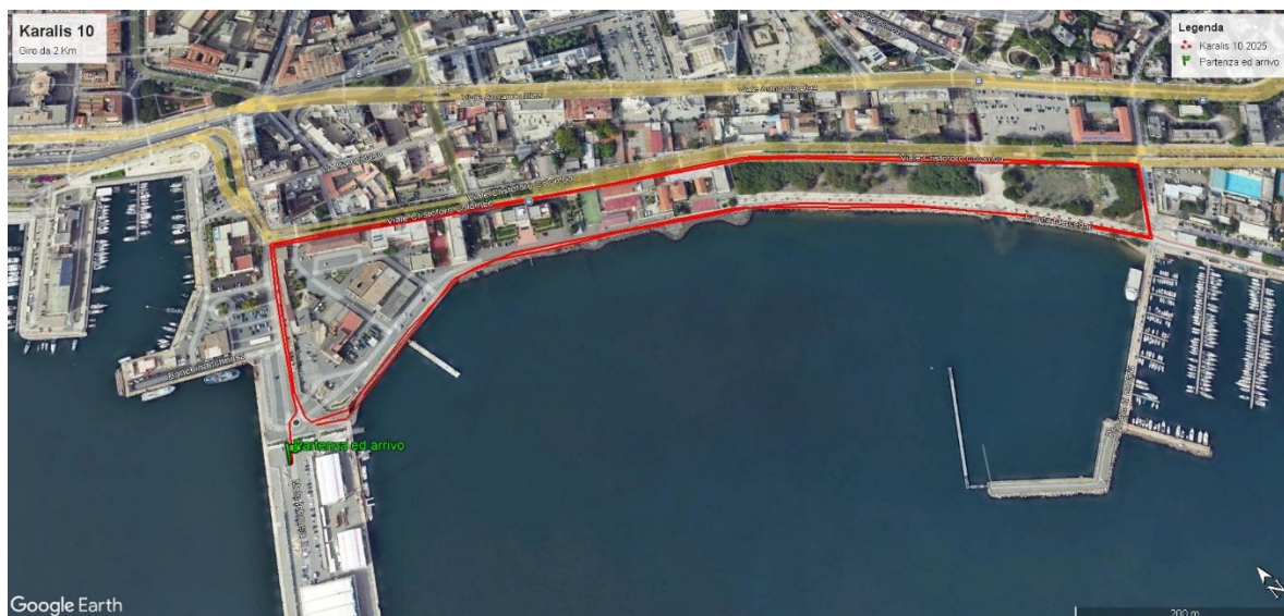
Circuito da 2 Km