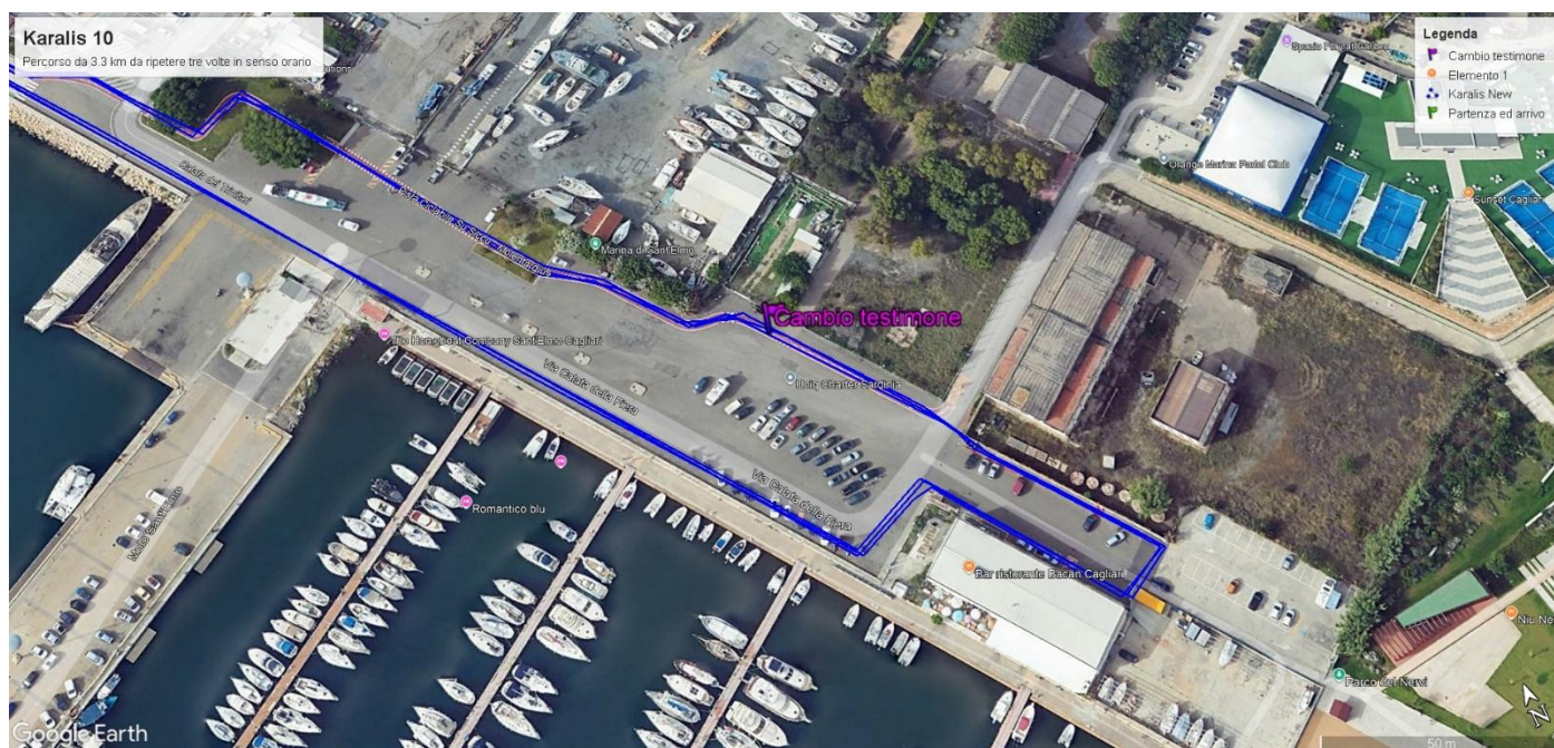
Cambio del testimone staffetta 2x5

La Staffetta 2x5 km avrà come punto di scambio del testimone la via Caboto altezza primi nuovi chioschi della passeggiata di su Siccu